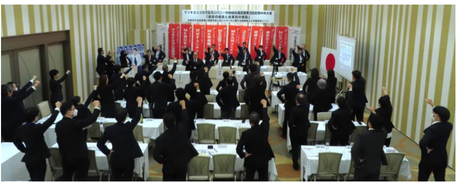
※大会では、マスクの着用は個人の判断にゆだねています。